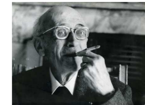
Boris de Schloezer

10h45 > 11h30 Tatiana Victoroff Boris de Schloezer et Alexandre Scriabine : dialogue d'un européen et d'un anti-européen 11h30 > 12h15 Gun-Britt Kolher Boris de Schloezer (1881-1969). Wege aus der russischen Emigration. Une relecture 12h15 > 13h Leonid Livak Boris de Schloezer passeur d'idées, de connaissances et de textes 13h > 13h15 Pierre-Henry Frangne Conclusion du colloque