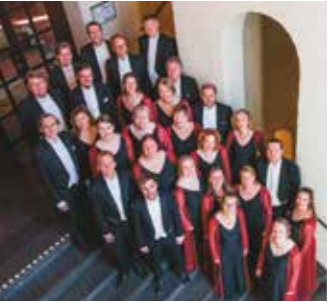
Eric Ericsons Kammarkör